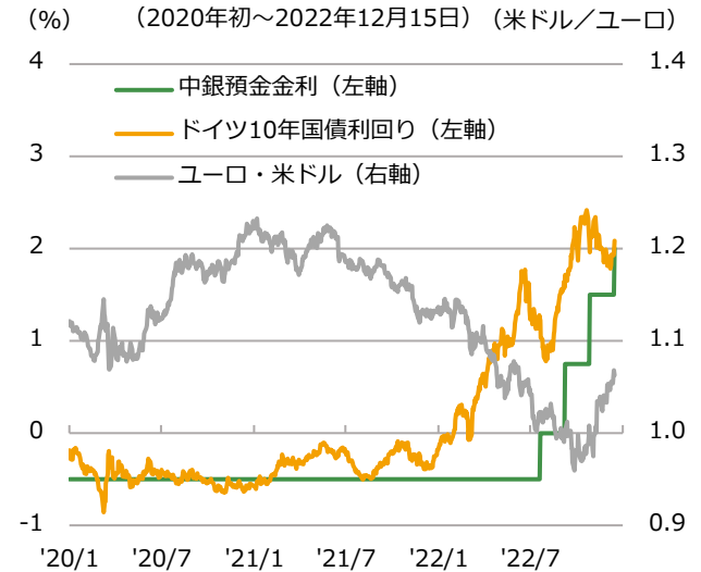
※中銀預金金利は決定日ベース (出所) ブルームバーク