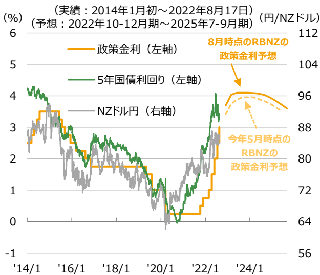
※政策金利は決定日ベース ※NZドル円は2022年8月16日まで