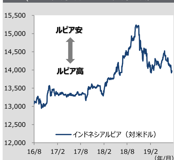
図表2 インドネシアルピアの推移（対米ドル） (2016年8月1日～2019年7月18日)

注：インフレ率は消費者物価指数の前年同月比上昇率 リフィニティブ、インドネシア銀行のデータをもとに、HSBC投信が作成